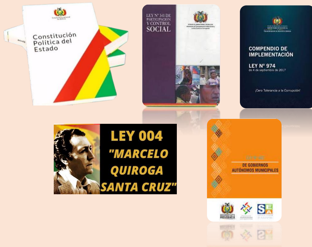
Imagen 1: normativas que facultan la rendición pública de cuentas en entidades territoriales

En conjunto, este marco normativo constituye el sustento jurídico que garantiza el derecho de la población a acceder a la información pública, participar en los procesos de fiscalización y ejercer el control social sobre la gestión institucional.